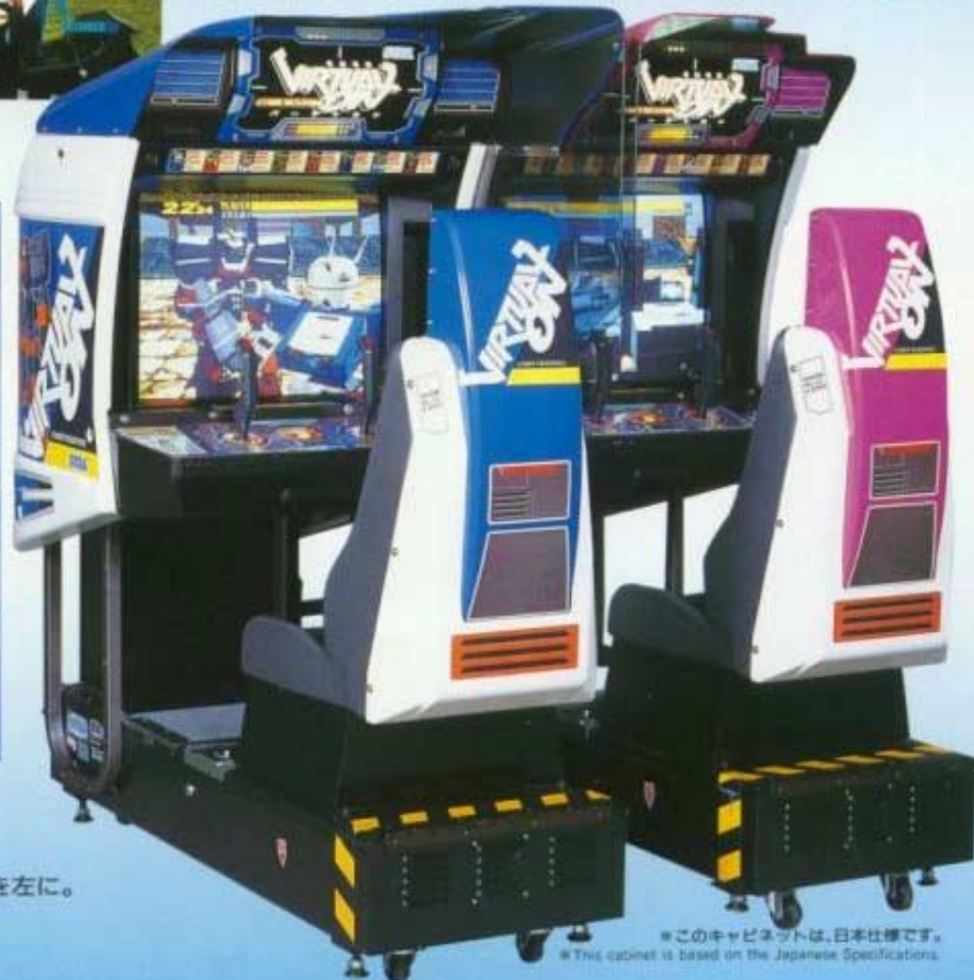
※このキャビネットは、日本仕様です。 ※This cabinet is based on the Japanese Specifications.

Hot fighting scenes represented by Polygon modeling 3-D CG! Awaiting you is the unknown excitement and astonishment you can only experience by actually operating the VIRTUALOID!